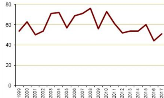
Número de víctimas mortales por violencia de género. 1999-2017

Nota: se incluyen aquellos casos en los que el agresor es el cónyuge, excónyuge, compañero sentimental, excompañero sentimental, novio o exnovio.